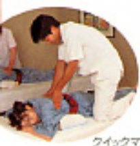
クイックマッサージ