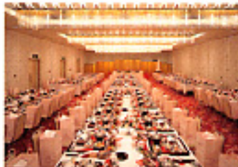
コンベンションホール