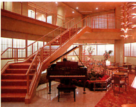
ナイトラウンジ「ミルキーウェイ」