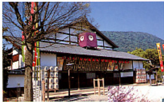
日全旅館大芝居・金大座