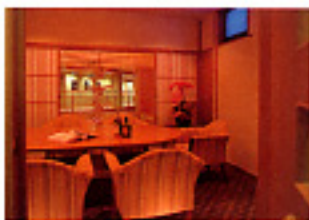
パーティールーム「花守」