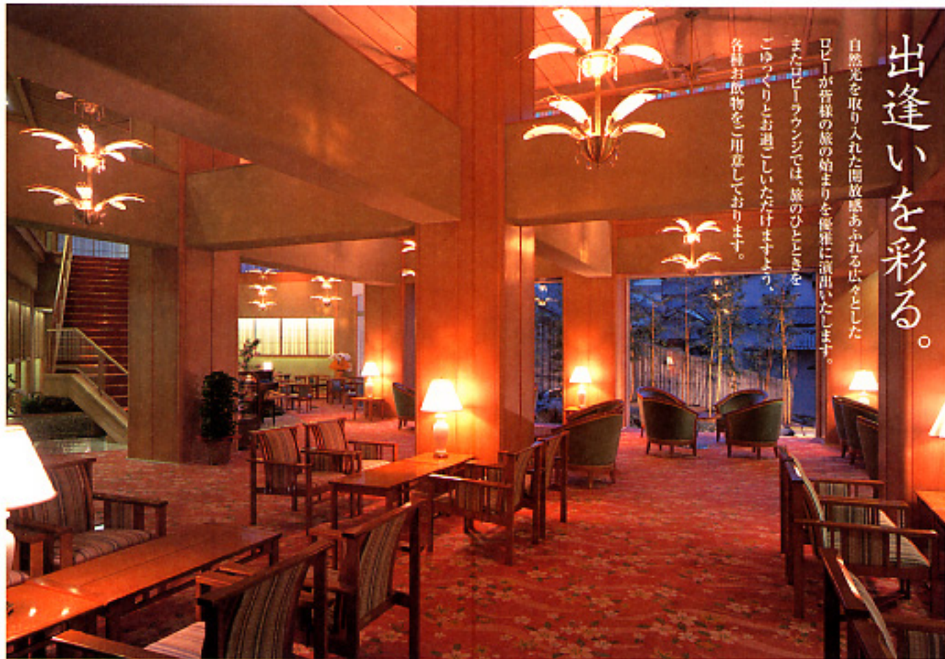
ロビーラウンジ「天の川」

自然光を取り入れた開放感あふれる広々とした ロビーが皆様の旅の始まりを優雅に演出いたします。 またロビーラウンジでは、旅のひとときを ごゆっくりとお過ごしいただけますよう、 各種お飲物をご用意しております。