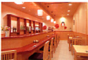
うどん屋「花のれん」