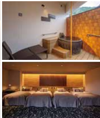
ゆすらんユニバーサルルーム