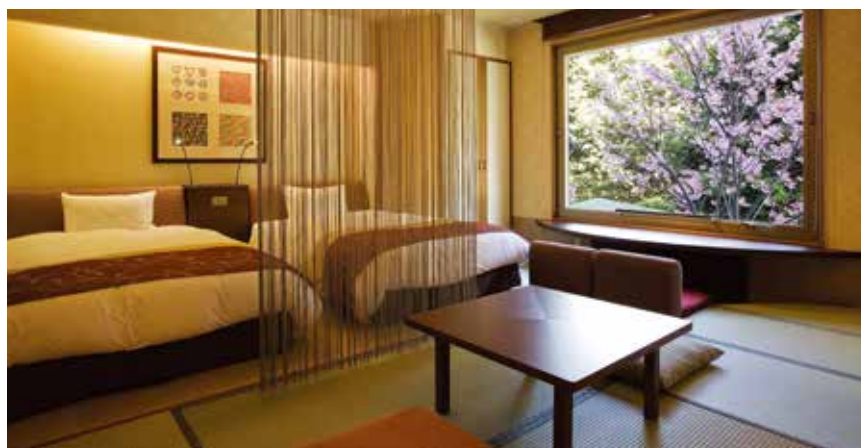
ゆすらん[スタンダードB]