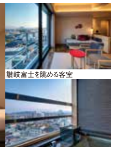
讃岐富士を眺める客室