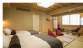
初音スタンダード (客室露天風呂は付いておりません)

「初音スタンダード サウナ&スパルーム」にコネクトルーム 「初音スタンダード」客室を1室追加したお部屋です。 ※3世代や小グループご旅行におすすめです。