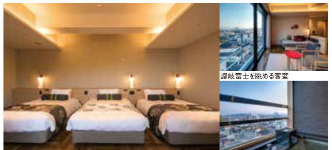
3ベッド+1ソファベッド