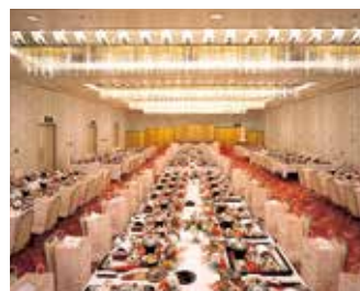
コンベンションホール