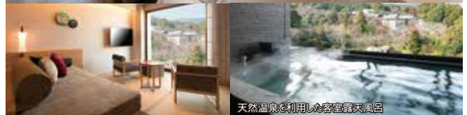
天然温泉を利用した客室露天風呂