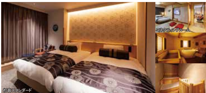
初音スタンダード