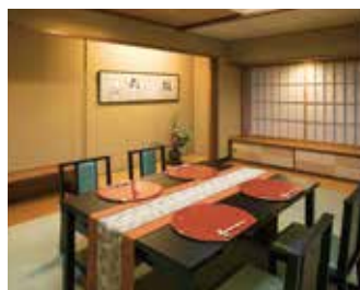
料亭「桜花亭」(椅子スタイル)