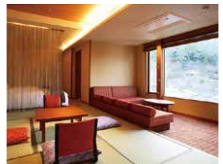
ゆすらん[デラックス]