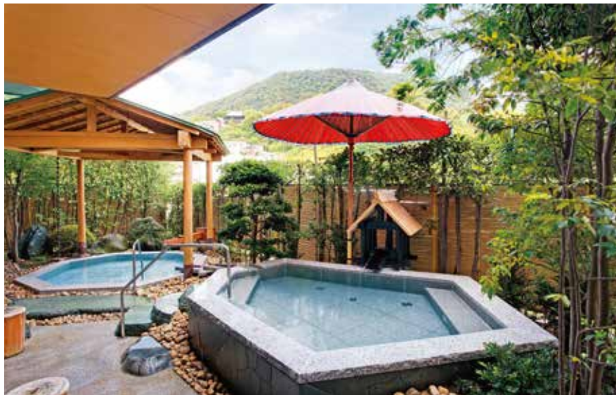
殿方露天風呂 “かぐらの湯”