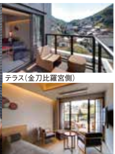
テラス(金刀比羅宮側)