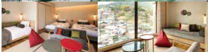
初音プレミアム 金刀比羅宮ビュー／露天風呂付和洋室