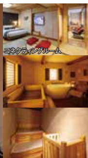
コネクティングルーム