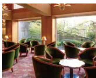
ロビーラウンジ「天の川」