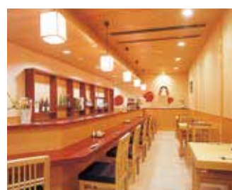
和風貸切カラオケルーム「花のれん」