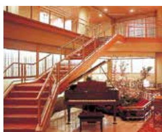
ナイトラウンジ「ミルクィウェイ」