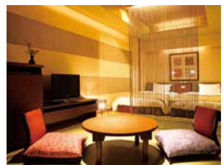
ゆすらん[スタンダードA]