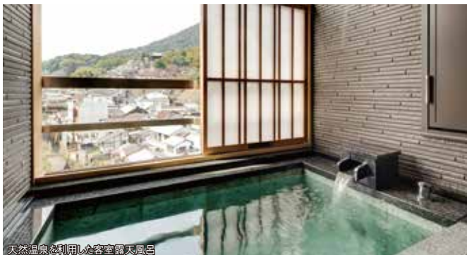
天然温泉を利用した客室露天風呂