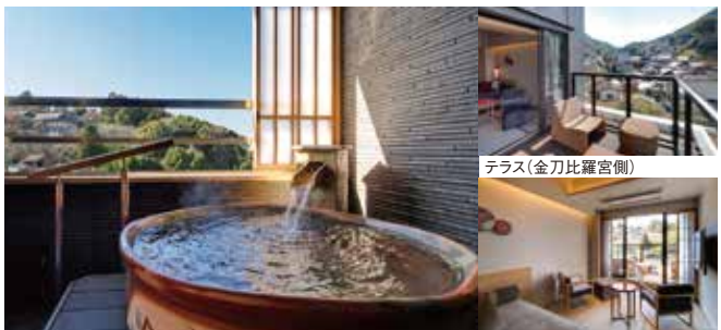
天然温泉を利用した客室露天風呂